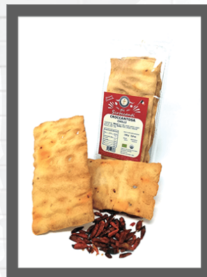
PEPERONCINO / CHILLI