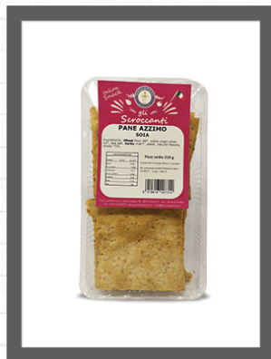
SOIA / SOY