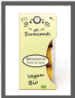
OLIO& SALE / OIL& SALT