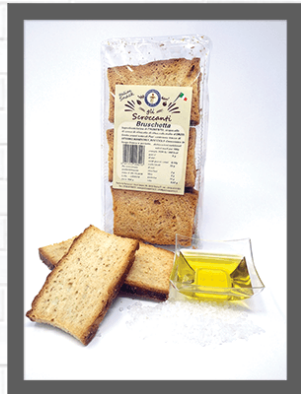
OLIO& SALE / OIL& SALT