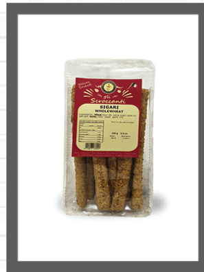
INTEGRALI / WHOLEWHEAT