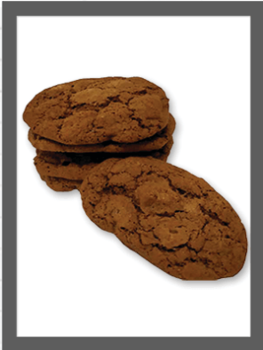
MORI UBRIACHI * BLACK AND DRUNK