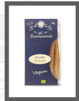
SESAMO / SESAME