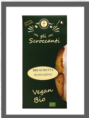
ROSMARINO / ROSEMARY