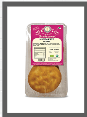
OLIVE / OLIVES