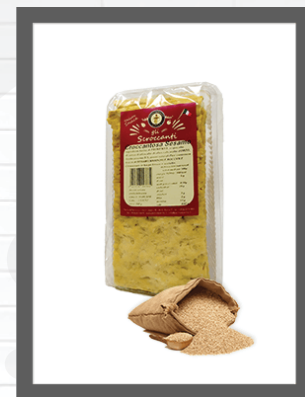
SESAMO / SESAME