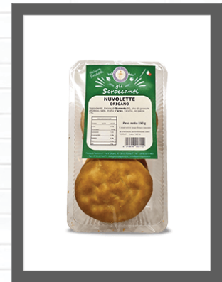
ORIGANO / OREGANO