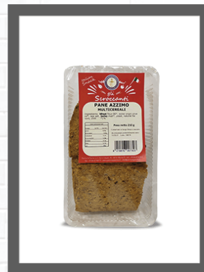
MULTICEREALI / MULTICEREAL