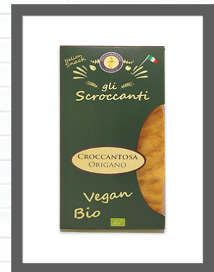
ORIGANO / OREGANO