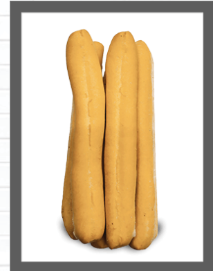
I SIGARI / THE CIGARS