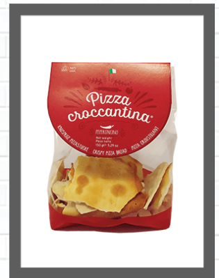
PEPERONCINO / CHILLI