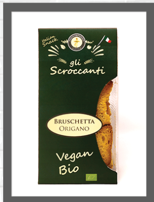
ORIGANO / OREGANO