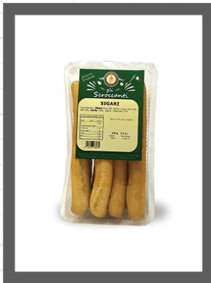
CLASSICI / CLASSIC