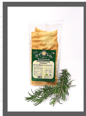
ROSMARINO / ROSEMARY