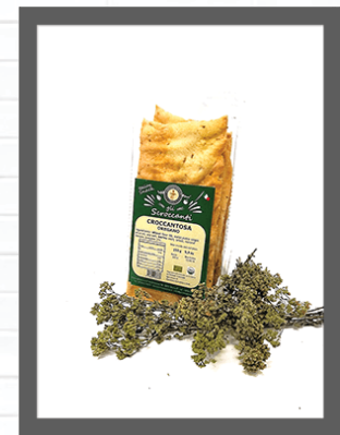
ORIGANO / OREGANO