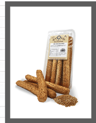
SESAMO / SESAME