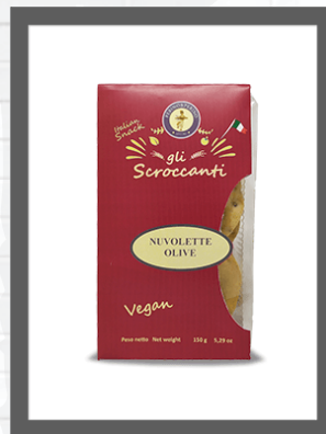
OLIVE / OLIVES