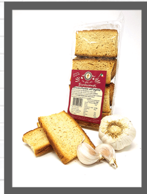
AGLIO / GARLIC