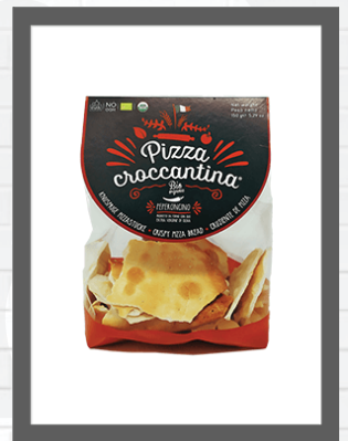
PEPERONCINO / CHILLI