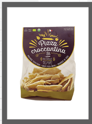
NATURALE / NATURAL