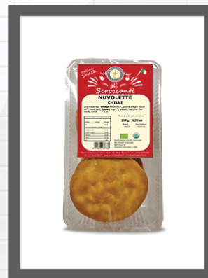
PEPERONCINO / CHILLI