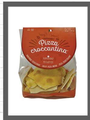
POMODORO / TOMATO