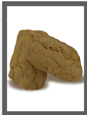
GUSTOSINI SWEET AND TASTY