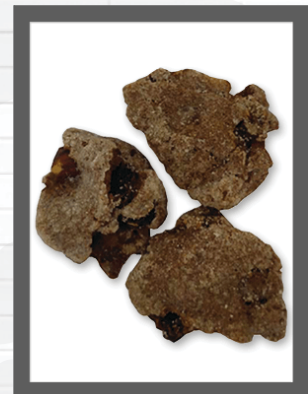
SASSI CIOCCOLATO E UVETTA LITTLE STONES WITH CHOCOLATE AND RAISINS