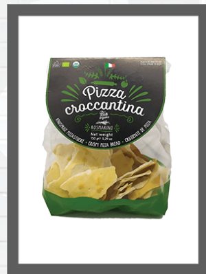
ROSMARINO / ROSEMARY