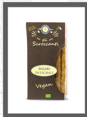
INTEGRALI / WHOLEWHEAT