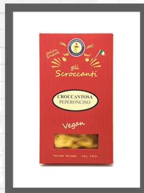
PEPERONCINO / CHILLI