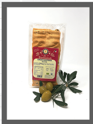
OLIVE / OLIVES