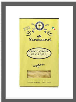
OLIO& SALE / OIL & SALT