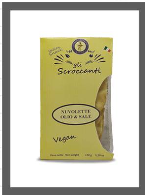
OLIO& SALE / OIL& SALT