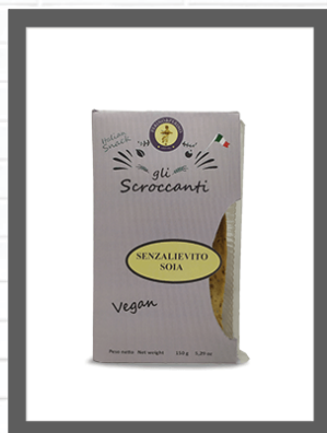
SOIA / SOY