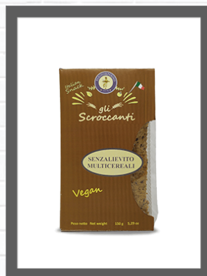
MULTICEREALI / MULTICEREAL