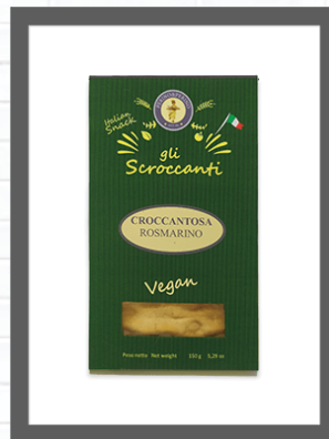
ROSMARINO / ROSEMARY