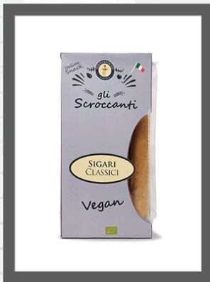
CLASSICI / CLASSIC