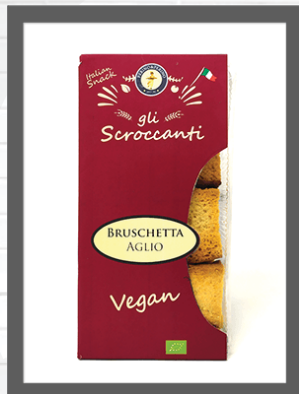
AGLIO / GARLIC