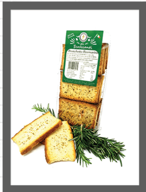
ROSMARINO / ROSEMARY