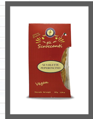
PEPERONCINO / CHILLI