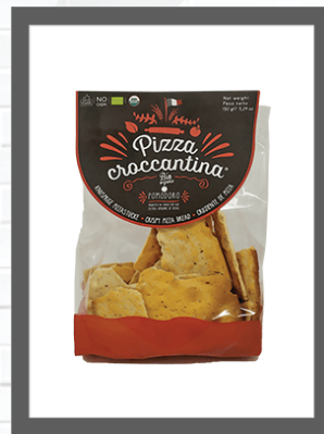
POMODORO / TOMATO