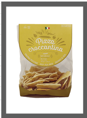
CLASSICA / CLASSIC