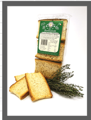
ORIGANO / OREGANO