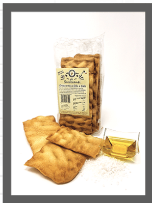
OLIO & SALE / OIL & SALT