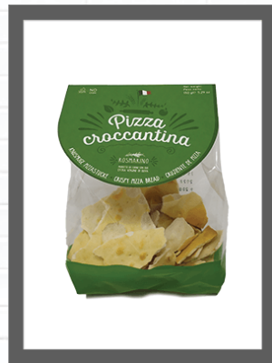
ROSMARINO / ROSEMARY