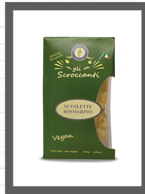
ROSMARINO / ROSEMARY