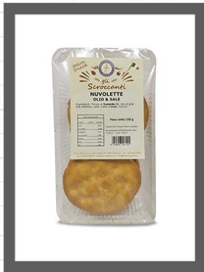
OLIO & SALE / OIL & SALT