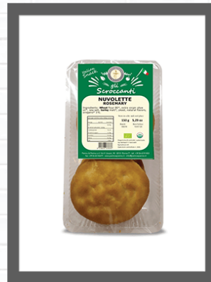
ROSMARINO / ROSEMARY